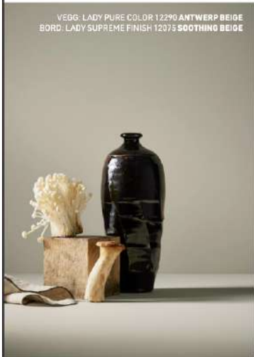
VEGG: LADY PURE COLOR 12290 ANTWERP BEIGE BORD: LADY SUPREME FINISH 12075 SOOTHING BEIGE