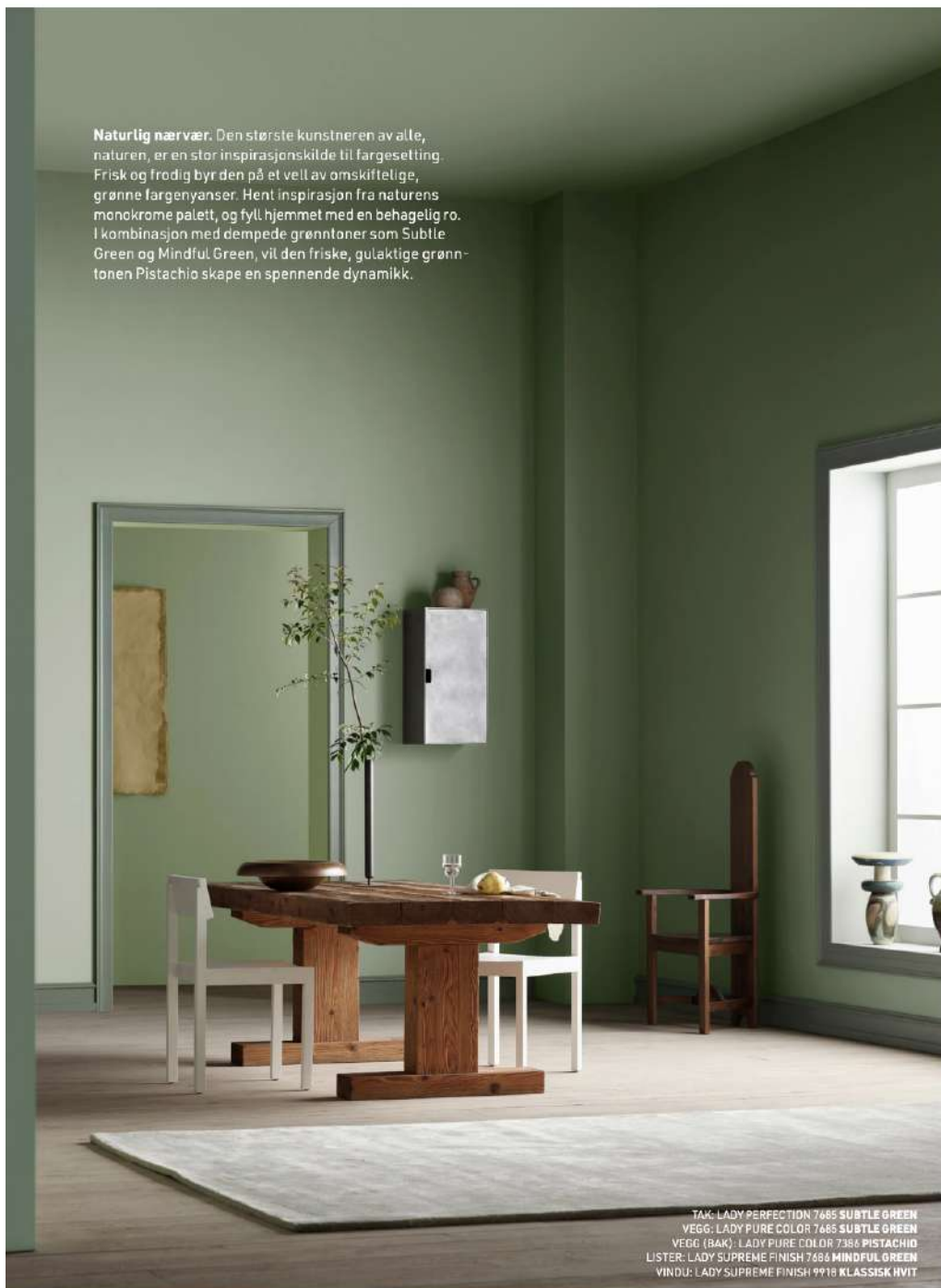
TAK: LADY PERFECTION 7685 SUBTLE GREEN VEGG: LADY PURE COLOR 7685 SUBTLE GREEN VEGG (BAK): LADY PURE COLOR 7386 PISTACHIO LISTER: LADY SUPREME FINISH 7686 MINDFUL GREEN VINDU: LADY SUPREME FINISH 9918 KLASSISK HVIT

Naturlig nærvær. Den største kunstneren av alle, naturen, er en stor inspirasjonskilde til fargesetting. Frisk og frodig byr den på et vell av omskiftelige, grønne fargenyanser. Hent inspirasjon fra naturens monokrome palett, og fyll hjemmet med en behagelig ro. I kombinasjon med dempede grøntonner som Subtle Green og Mindful Green, vil den friske, gulaktige grøntonnen Pistachio skape en spennende dynamikk.