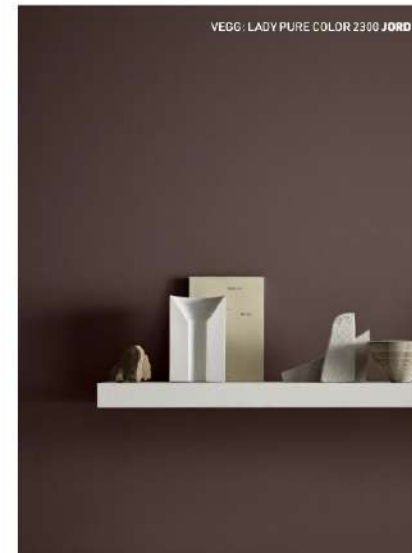
VEGG: LADY PURE COLOR 2300 JORD