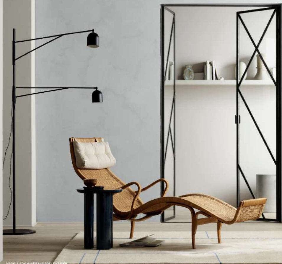
VEGG: LADY MINERALS 5081 FABRIKK VEGG (VENSTRE): LADY PURE COLOR 12077 SHEER GREY VEGG (BAK): LADY PURE COLOR 1376 FROSTRØYK HYLLE: LADY SUPREME FINISH 1376 FROSTRØYK

Varmt og kaldt. Farger fra blå og gygne fargefamilier kan kombineres for å skape forfinet harmoni av kjølige farger mot varmere toner. Lyse, lune nøytraler bidrar med myk komfort i en ellers kjølig fargepalett bestående av grå og hvite nyanser. Den kalkmatte overflaten til LADY Minerals gir veggene et unikt preg – med vakker dybde og tekstur.