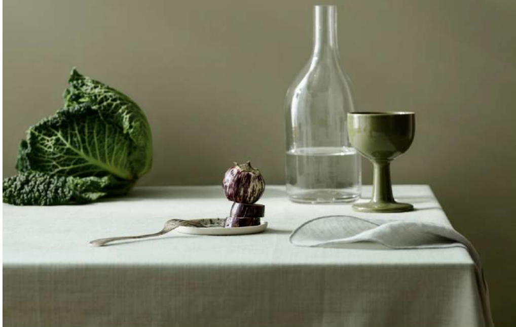
BORD: LADY SUPREME FINISH 1376 FROSTRØYK