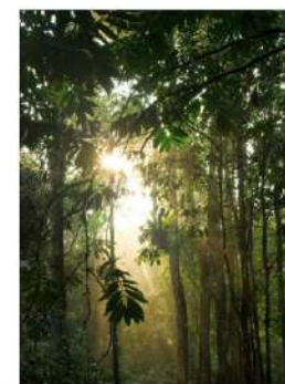
VEGG: LADY PURE COLOR 7686 MINDFUL GREEN