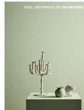
VEGG: LADY PURE COLOR 7386 PISTACHIO