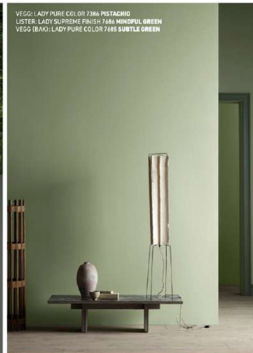
VEGG: LADY PURE COLOR 7386 PISTACHIO LISTER: LADY SUPREME FINISH 7686 MINDFUL GREEN VEGG (BAK): LADY PURE COLOR 7685 SUBTLE GREEN

LADY Pure Color – gir en unik fargeopplevelse med et eksklusivt supermatt utseende.