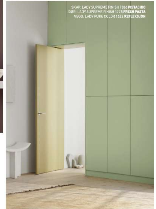
SKAP: LADY SUPREME FINISH 7386 PISTACHIO DØR: LADY SUPREME FINISH 1775 FRESH PASTA VEGG: LADY PURE COLOR 1622 REFLEKS JON

LADY Perfection takmaling – enkel å påføre uten drypp og søl. Stort fargeutvalg.